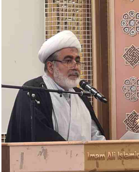
الشيخ حكيم الهي

اللهم ارزقنا زيارة قبره في الدنيا وشفّاعته في الآخرة كان ذلك في ١٢ أيار (مايو) ٢٠٢٣.