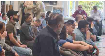
تأني من الحضور

اخواني واخواتي! في ختام خطبتي هذه اود ان اشير لرساله الامام علي بن موسى الرضا الى شيعة عموما والينا خصوصا. الإمام الرضا (ع) يلتقي بتلميذه (السيد عبد العظيم الحسني) الذي يُزار في منطقة الري المسمى بشاه عيد العظيم، فلقد كان يرسله ليبلغ أوليائه ما يريد منهم، لأنّه كان يفكر بهم ويراقب أوضاعهم فقال (ع): يا عبد العظيم ابلغ عني اوليائي السلام، وقل لهم ان لا يجعلوا للشيطان على انفسهم سبيلاً، ومرهم بالصدق في الحديث، واداء الأمانة ومرهم بالسكوت وترك الجدل فيما لا يعينهم واقبال بعضهم على بعض والمزاورة فإن ذلك قربة اليّ ولا يشغلوا انفسهم بتمزيق بعضهم بعضاً فإنني آليت على نفسي انه من فعل ذلك واسخط ولياً من اوليائي دعوت الله ليعذبه في الدنيا اشد العذاب، وكان في الآخرة من الخاسرين.