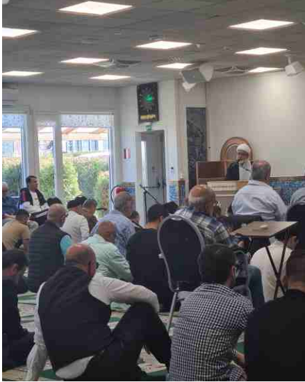
تأني من الحضور

وصلوا إلى مدينة شيراز في جنوب بلاد فارس، منعهام حاكم مدينة شيراز من السفر بأمر من المأمون. فدارت بينهم معارك انتهت إلى مقتل عدد من بني هاشم والباقيين قد تشتتوا في مناطق مختلفة، ولجأ السيد احمد وأخوه محمد إلى منزل أحد مواليتهم في شيراز وبقيا مختلفين هناك حتى تمكن الحاكم من معرفة مكانهم من خلال جواسيسه، فهجم على الدار وأمر بقتلها ثم هدم الدار عليهما.