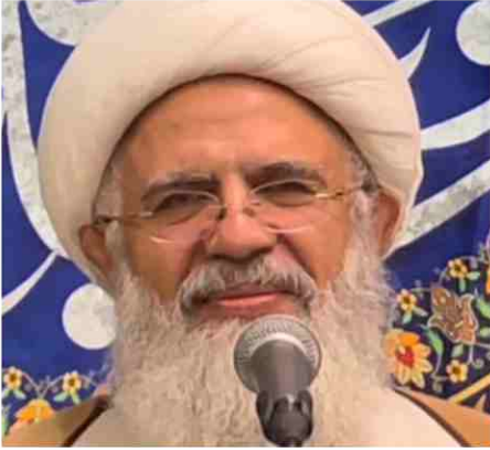
الشيخ يوسف قاروط