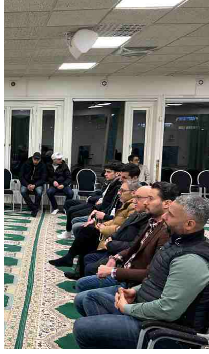
حاضري من الحضور

ابتدأ سماحة الشيخ ناظم الوائلي كلمته التي ألقاها في ليلة الجمعة في الرابع من شهر أيار (مايو) ٢٠٢٣، في ذكرى هدم قبور البقيع، ببيان معنى كلمة بيوت في قوله تعالى "في بيوت أذن الله أن ترفع ويذكر فيها اسمه"، موضحاً أنها بيوت للنبوة وللإمامة وللعبادة وللعلم، معرّجاً على الذكرى السنوية لهدم تلك القبور، معتبراً أنها قبور لعظماء كانوا من سكان البيوت التي أذن الله أن تُرفع ويذكر فيها اسمه.