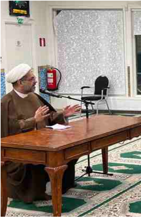
الشيخ ناظم الوائلي