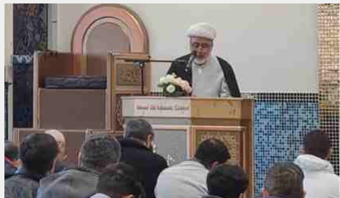
الشيخ حكيم إلهي