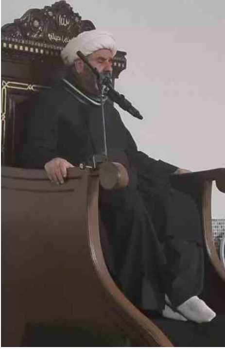
الشيخ عباس الطريحي

إذا رأى المرء نفسه منعماً ولا ينغصه أي شيء في الحياة فليعلم بأن القضية خطيرة جداً وقد دق ناقوس الخطر الآن عنده.