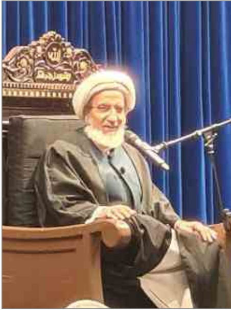
الشيخ حبيب الكاظمي

أهل هذه البلدان ينتظرون عطلة نهاية الأسبوع للاستجمام، [أما نحن] فبحاجة إلى سباحة باطنية